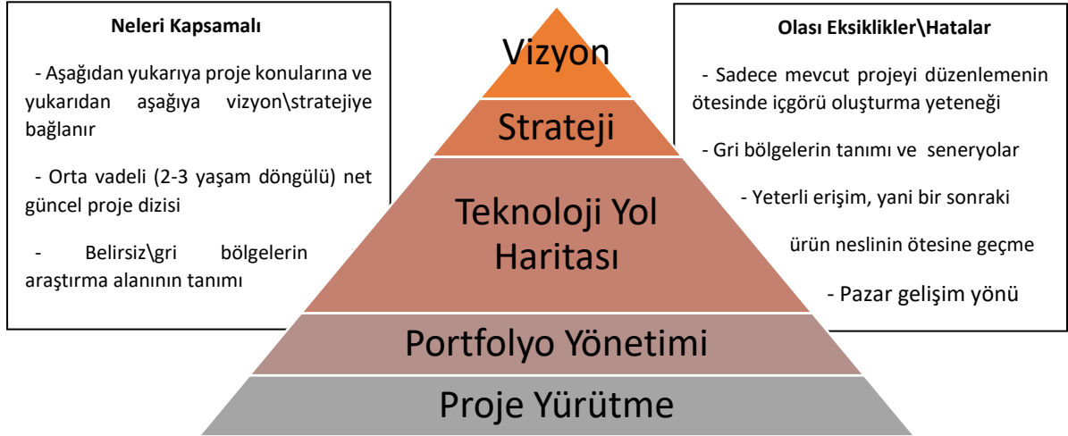
Şekil 1: Efektif bir TYH'nin birimin yönetim ve politika pramidinde yer aldığı konum

Teknoloji yol haritaları (TYH), kuruluşların stratejik planlamaları ile uyumlu, son kullanıcılarının ihtiyaç ve gereksinimlerini karşılayacak yeni ürün veya hizmetleri başlatmak için gereken teknolojileri görselleştiren araçlardır. TYH, kuruluşların hem mevcut ihtiyaçları anlamalarına hem de gelecekteki ihtiyaçları tahmin etmelerine yardımcı olarak, teknoloji gereksinimlerini belirlemeyi kolaylaştırır. TYH, aynı zamanda paydaşların teknoloji manzarası değişirse hızla adapte olmalarına yardımcı olarak kaynakları optimum kullanabilmeyi, inovasyon ve yeni ürün geliştirme faaliyetlerini etkin yürütebilmeyi sağlamaktadır. Dolayısıyla Şekil 1’den de görüleceği üzere TYH kurumların alanlarına uygun konularda mevcut ve ileriki zamanlarda ihtiyaçların belirlenerek hedefe yönelik projelerin hazırlanıp yürütülmesiyle kurumun gelişim strateji ve vizyon politikaları oluşumunda bir köprüdür.